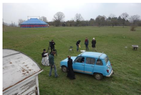
© Horst und Fässler, Béatrice Didier, Cirque de Loin