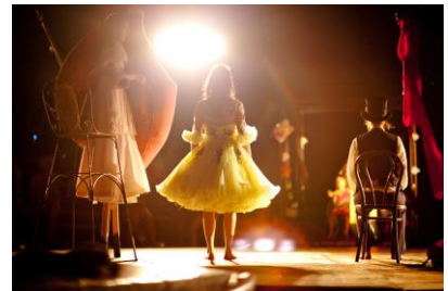
© Horst und Fässler (1 & 3), 7 Pépinières